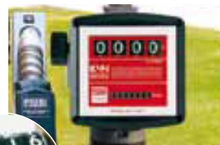
Pulsar version available (K44)