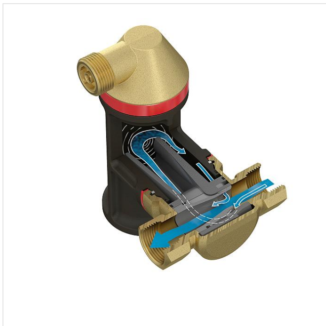
Selection table for Flamcovent & Clean Smart series