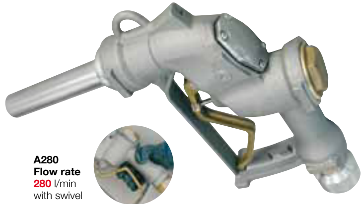
A280 Flow rate 280 l/min with swivel