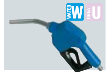
UREA nozzle available