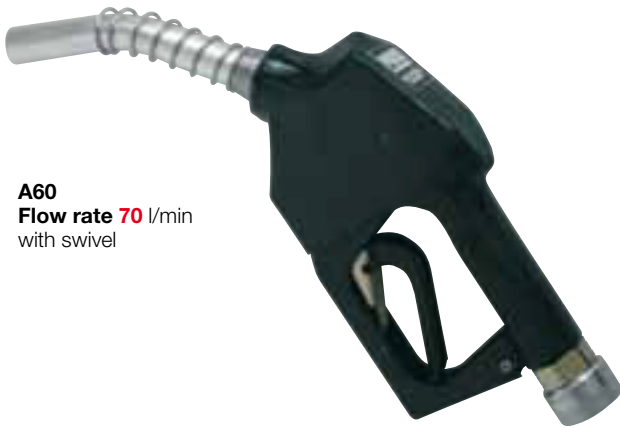
A60 Flow rate 70 l/min with swivel