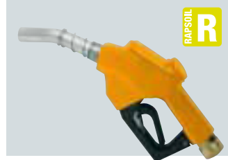
RAPSOIL nozzle available