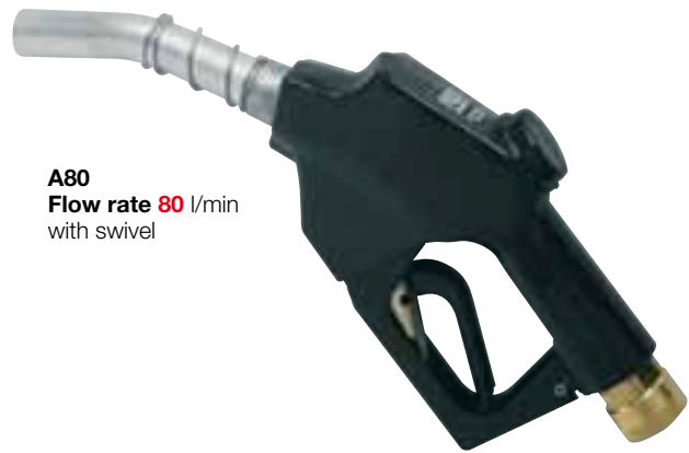
A80 Flow rate 80 l/min with swivel