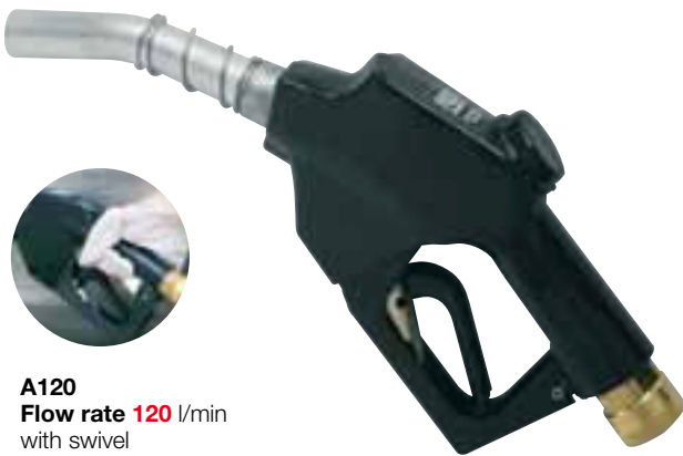
A120 Flow rate 120 l/min with swivel