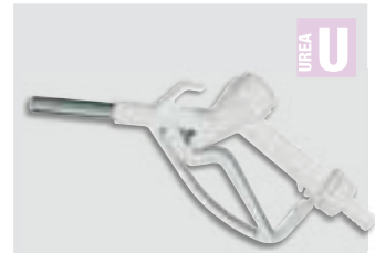
UREA nozzle available